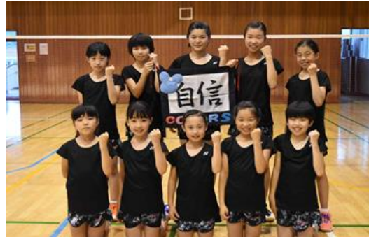
平成29年若葉カップ参加チーム

日時 平成30年4月15日(日) 会場 岡垣サンリーアイ・ウエーブアリーナ 主催 福岡県バドミントン協会 福岡県小学生バドミントン連盟 後援 福岡県教育委員会 主管 福岡県小学生バドミントン連盟 遠賀郡バドミントン協会 岡垣町バドミントン連盟